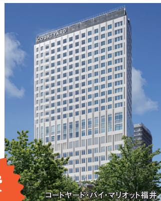
コートヤード・バイ・マリオット福井