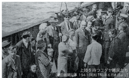
上陸を待つユダヤ難民たち 【朝日新聞記事 1941(昭和16)年6月6日より】