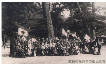
敦賀の松原での孤児たち